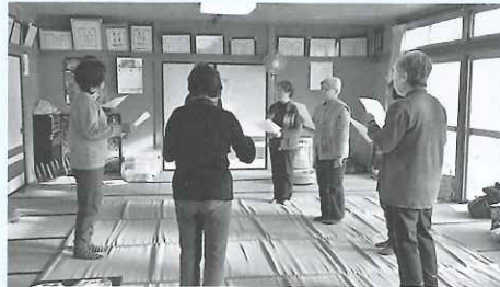
「りんごの歌」を歌って、体も動かして♪