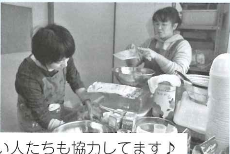
若い人たちも協力してます♪