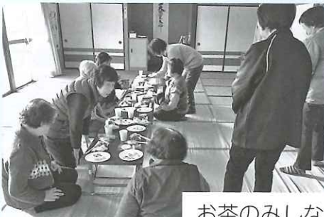
お茶のみしながらおしゃべり