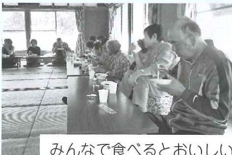
みんなで食べるとおいしいです