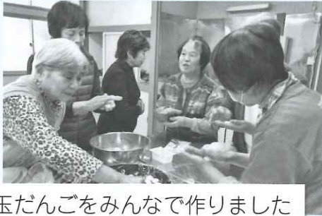
白玉だんごをみんなで作りました