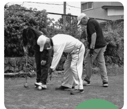
高校生と ゲートボール 交流会